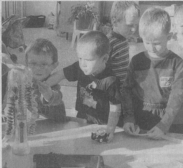
Děti z Mateřské školy v Rochlově.