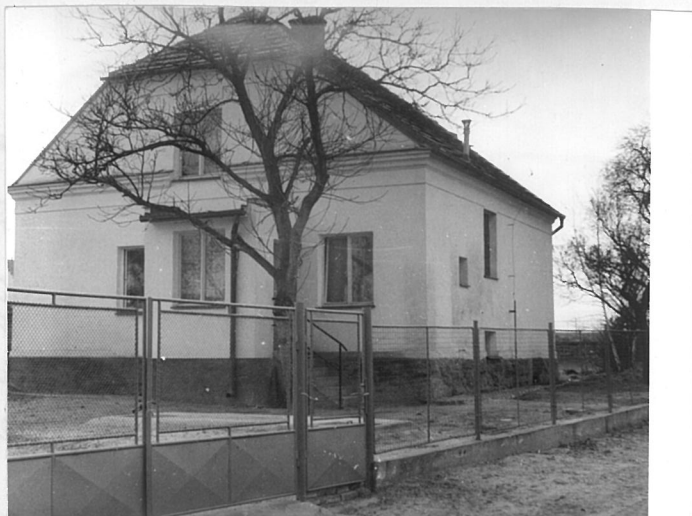
.... a po opravě při pohledu do dvorka,