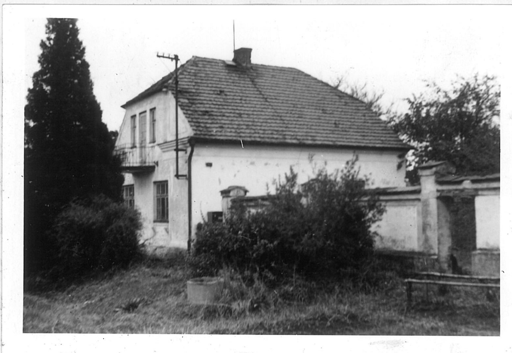
Domek č.p. 85 - vážalský byt, PŘED OPRAVOU.....