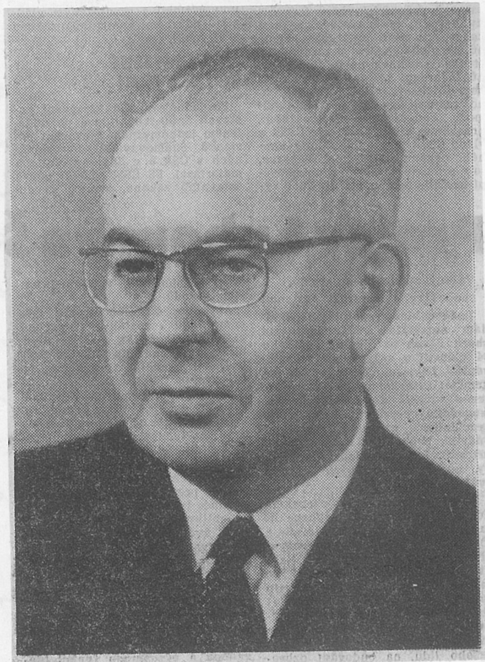
8. prezident Československé republiky s. Gustav Husák.