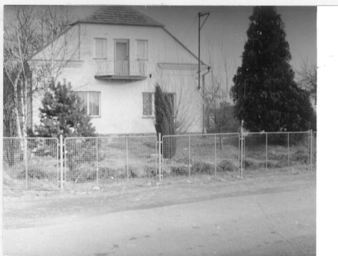
a při pohledu z hlavní silnice.