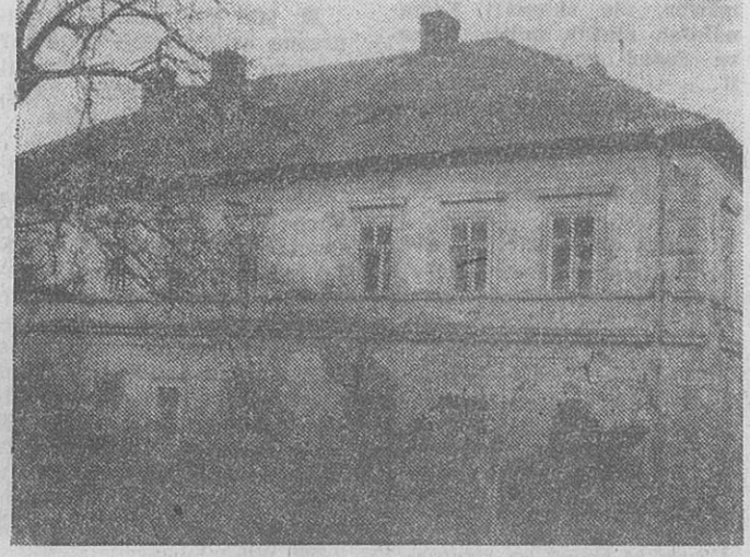
BAROKNÍ ZÁMEČEK v Rochlově.

Především ONV musí zvýšit pozornost i k památkám III. kategorie. Zaručit, aby nedocházelo k dalšímu ničení. Je to hlavně otázka střech, což je základ. Plně se to týká naší obce Rochlov v okrese Píseň-sever. Je zde venkovský barokní zámek z roku 1711 (se zámeckým parkem) o rozměrech 33x17x11 m, jednopatrový se 45 okny a 14 místnostmi různé velikosti. Je schopen rychlé opravy, aby mohl sloužit nadále nějakému účelu. Naše obec by vděčně uvítala, kdyby někdo projevil zájem a zámek měl lepšího majitele, než byly ČSSS Úlice, n. p. Zachovala by se hodnota pro lidi, kteří na venkově