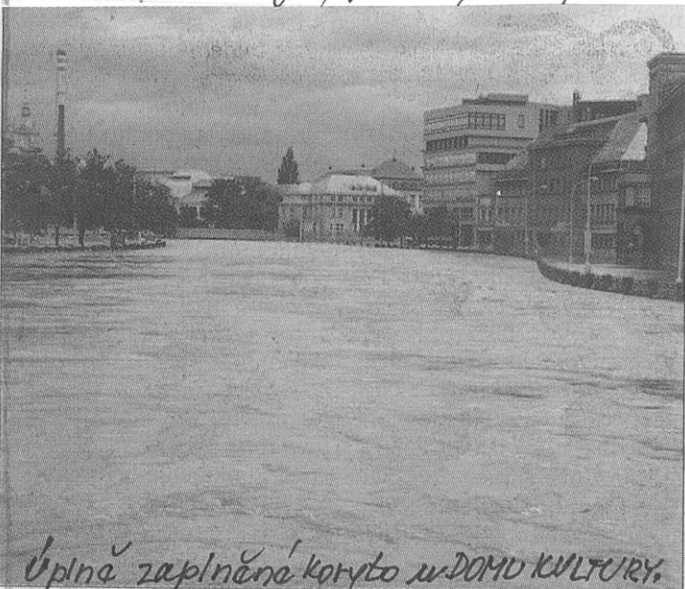
Úplně zaplněné koryto u DOMU KULTURY. 100letá voda na Radbuze v centru Plzně. 2002.

4.8. dopol. deště, bouřka, 7 a 8.8. hodně pršelo, velký jukol do rybníka a tea přetaki u parku, spodní zahrady trochu pod vodou, 20°C. 11.8. opět prší, 12. celý den a celou noc a vlněla u nás velká jvodeň (u nás v 30-50 litrá voda). Vody od nás jdou do potoka a řek a tam se dáleka více slíjí, u mohutné vody a tak v těchto ozvláště 100 litrá jvodeň a nepáchala velké škody. Škody se odhadují až na 65 mld. Kč. (Před 5 lety na Moravě byly škody v 50 mld. Kč.) U nás nejvíce vody teče z lesů Harakaska